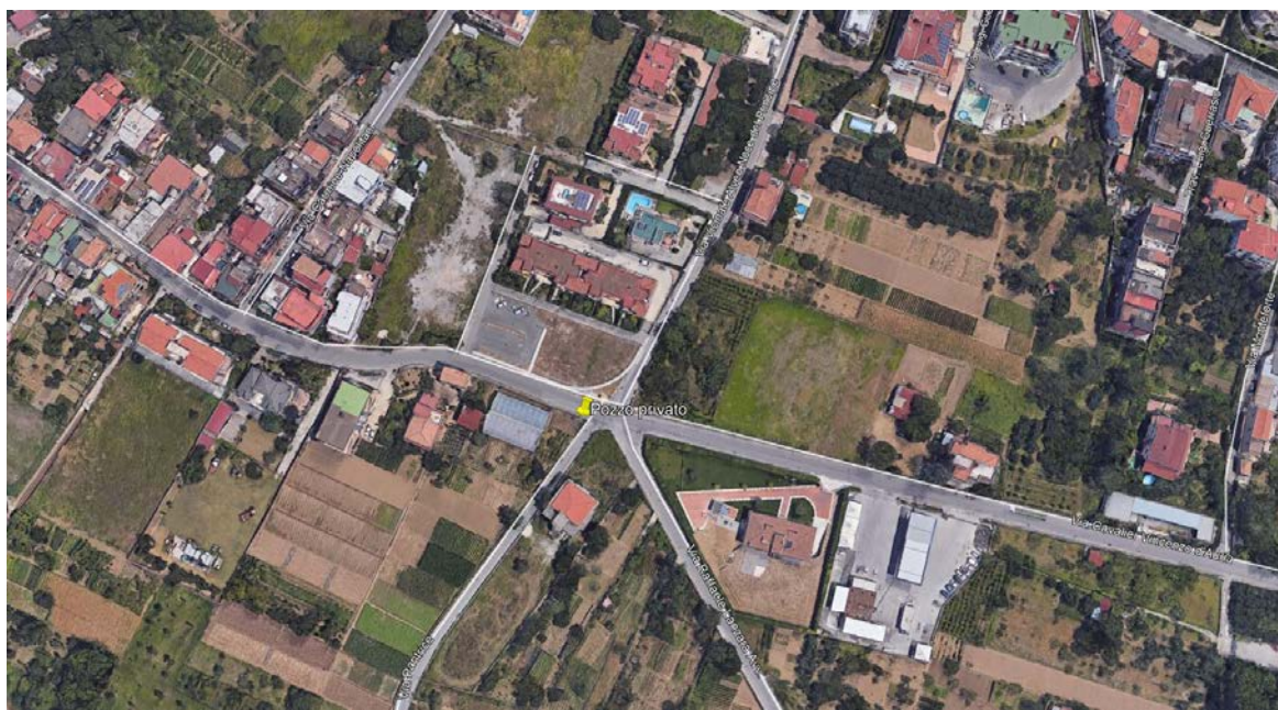
Figura 1 - inquadramento territoriale pozzo Via Pantrice (ortofoto)

Esso insiste sul fondo agricolo identificato in Catasto Terreni del Comune di Castel San Giorgio al foglio n. 8 mappale n. 2910 avente estensione di 16 mq contigua alla più ampia particella n. 2909 di stessa proprietà; il boccapozzo risulta posizionato a circa 1,5 metri da Via Cav. Vincenzo D'Auria e a circa 7 metri da Via Pantrice (misurazioni effettuate tramite tecnica GIS).