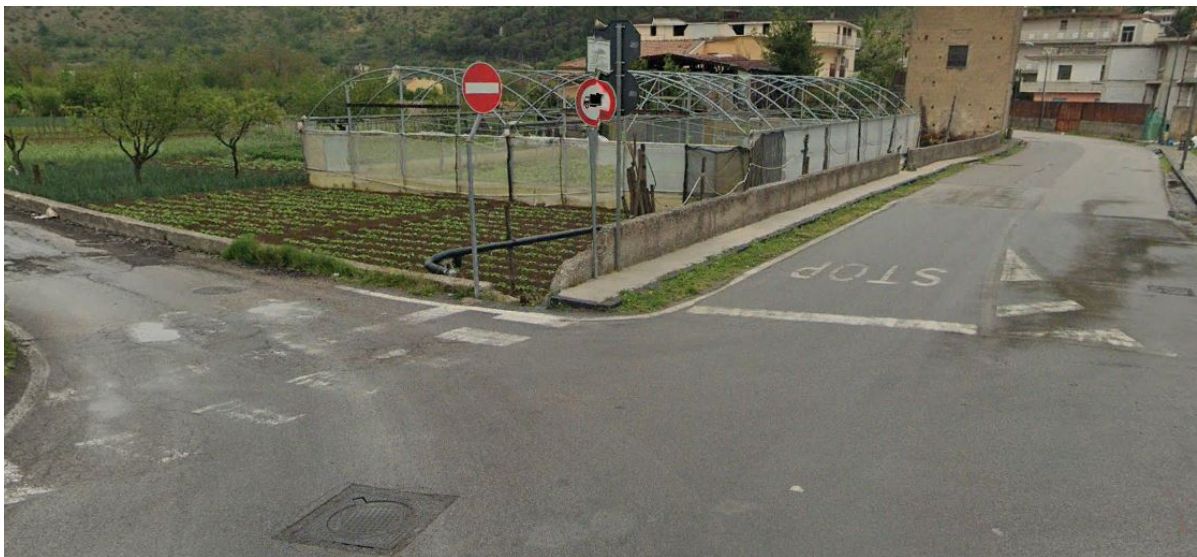
Figura 3 - inquadramento territoriale pozzo Via Pantrice (visuale da Via Cav.D'Auria)