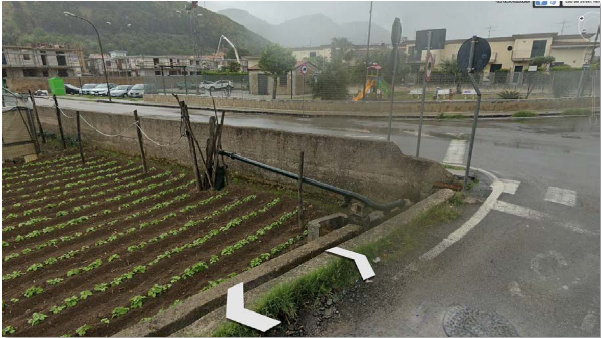
Figura 2 - inquadramento territoriale pozzo Via Pantrice (visuale da Via Pantrice)